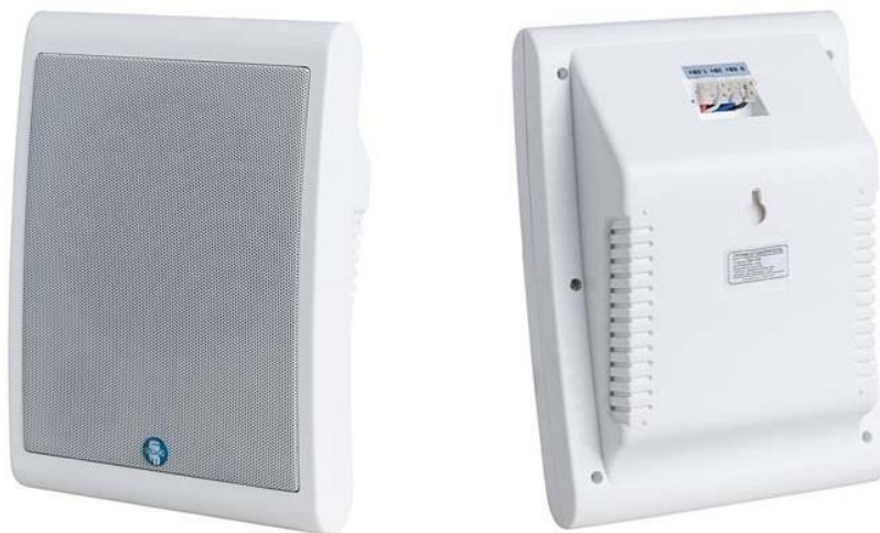
Рис. 1. Внешний вид громкоговорителя.

Внешний вид громкоговорителя показан на рис. 1.